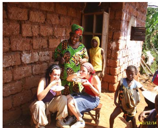
En train de déguster le taro national...

Depuis septembre 2003, le Groupe de Scout Makarenko de Barcelone travaille d'arrache pied pour équiper la Kinder's House. Grâce au travail de fourmi abattu par les enfants de ce mouvement pour aider les enfants de Banéghang, parce qu'ils sont convaincus que les tout petits peuvent aider les enfants, bientôt nous aurons la chance de recevoir un container de matériel didactique et autres équipements pour l'école. Le week end du 20 au 21 décembre, ils ont organisé une grande fête pour sceller l'amitié entre la Catalogne et le Cameroun. La fête fut un très grand succès qui a été retransmise dans les médias locaux. MERCI PETITS SCOUTS!