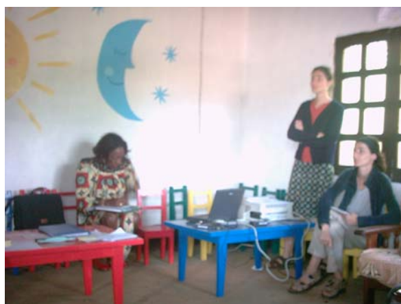
Une vue de la salle à la fin des travaux de réhabilitation