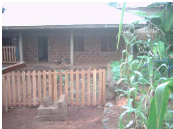
Une vue d'ensemble de la structure pendant les travaux de réfection et de réhabilitation.