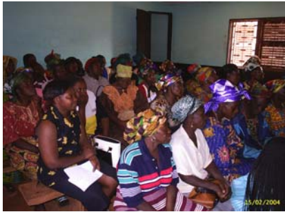
Atelier de renforcement des capacités en gestion des crédits.

ces hommes et ces femmes, croyez-moi, sont capables de se développer eux-mêmes. Et ils savent parfaitement quel genre de développement leur convient. Ce dont ils ont besoin, c'est d'un renforcement de leurs capacités afin qu'ils puissent s'auto-développer.