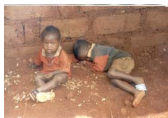
Une des manifestations de la pauvreté...

Car c'est de cela qu'il s'agit. En effet, la violence, ce n'est pas seulement l'absence de guerre. Ce n'est pas non plus seulement des coups que l'on peut porter sur quelqu'un. Il y a violence lorsque je ne peux pas manger à ma faim et bien, me soigner dans de bonnes structures sanitaires, habiter une maison décente, avoir une bonne éducation, disposer de ma vie comme je l'entends, décider du nombre d'enfants que je veux avoir, quand je veux, choisir librement mes vêtements, mes amis et refuser la compagnie de ceux qui m'indisposent, aller où je veux, quand je veux, etc.