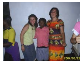
Une image des volontaires espagnols la veille de leur départ