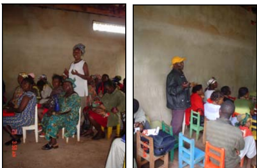
Une attitude des participants

Il s'agit, par exemple, de l'environnement qui n'est du tout favorable, avec certaines structures gouvernementales qui sont de véritables obstacles et qui pourraient, si les choses ne se solutionnent pas vite, briser l'élan des promoteurs de l'ONG. Il y a aussi les mentalités qui sont difficiles à changer dans cette zone rurale parce que les hommes s'accrochent aux traditions obsolètes et antiprogrès. Les participants ont invité tous les acteurs de développement de la communauté à se mettre ensemble pour mieux lutter efficacement contre les causes structurelles de la pauvreté et contribuer à créer des rapports sociaux plus égalitaires entre les hommes et les femmes, condition sine qua non pour un développement humain durable ■