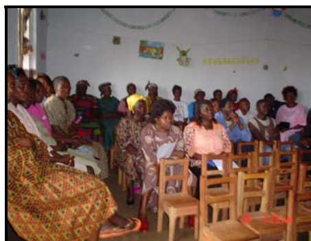
Réunion A.P.E Kinder's House de Penka Michel

Les deux années dernières, nos écoles ont été financièrement subventionnées à hauteur de 62%. Dans les cinq prochaines années ou même plus, nous serons obligés de tendre encore la main à nos partenaires jusqu'à ce que nos écoles soient à mesure de s'auto-gérer.