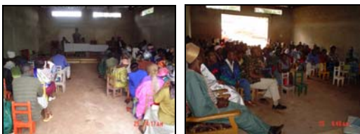
Les participants suivant attentivement les travaux de l'Assemblée Générale de AFFAMIR du 13 août dernier

hommes formés dans des ateliers de formation en technique d'agriculture moderne, de fertilisation et conservation des produits agricoles et autres champ-école, etc.