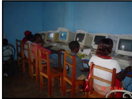
Enfants prenant des cours d'informatique au Centre d'Informatique de Penka Michel de AFFAMIR

Mais le programme de sensibilisation continue aussi bien auprès des principaux bénéficiaires de cette activité-les jeunes, les jeunes filles non scolarisées, les jeunes filles mères, les cadres et autres fonctionnaires, etc.- que des parents car il est nécessaire d'attirer l'attention de ces derniers sur le sort qui guette leurs enfants ainsi que la jeunesse de Penka-Michel si elle ratait ce train du développement lancé par AFFAMIR avec l'aide de ses partenaires.