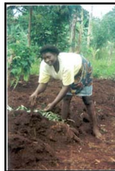
Impossible de produire plus et de ne pas ruiner sa santé avec des techniques aussi rudimentaires...

« Nous, les femmes du monde, devons participer à cette guerre nécessaire –non pas contre nos hommes- mais contre la pauvreté, l'ignorance, l'inégalité et l'injustice. Nous, les femmes, ne sommes pas meilleures que nos hommes, mais sommes bien trop utiles pour que nos propres pays ainsi que le monde entier se passent de notre participation active à la lutte pour la paix et le développement. ».