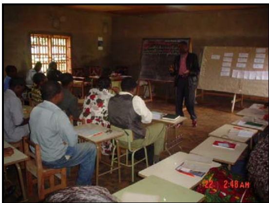
Une attitude des participants pendant l'atelier de recyclage

Ensuite et enfin parce que ce qui manque le plus à nos directeurs et à nos enseignants ce ne sont pas les connaissances sur leurs disciplines respectives à enseigner.