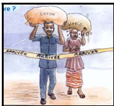
A quand l'égalité d'opportunités entre les hommes et les femmes ?

AFFAMIR voudrait faire une différence et continuer à travailler pour notre communauté, pour les femmes et pour les enfants. Réaliser ses activités de développement avec efficacité, pour atteindre ses objectifs, pour voir se concrétiser sa vision qui est l'avènement d'un monde où des relations inégalitaires cèdent la place à d'autres plus égalitaires entre les hommes et les femmes.