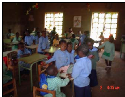
Des élèves dans une salle de classe à la Kinder's House de Banock

La Kinder's House de Banock ouvre ses portes pour la troisième année. En 2004-2005, l'école comptait trois classes, 78 élèves. Son personnel comprenait trois enseignantes, une assistante et un cuisinier. En ce jour de septembre, l'école enregistre déjà 80 élèves répartis dans quatre classes dont le CP, et qui seront encadrés par quatre enseignants et une assistante qui ont été recyclés en août dernier pour mieux utiliser les compétences et habiletés qui sommeillent en eux. L'école bénéficie également des services d'un chauffeur qui assurera le transport des élèves et d'un agent d'entretien et de deux gardiens qui assurent la sécurité de la structure. Tout ce beau monde sera encadré par la Directrice et le Comité de Gestion, l'organe de planification stratégique.