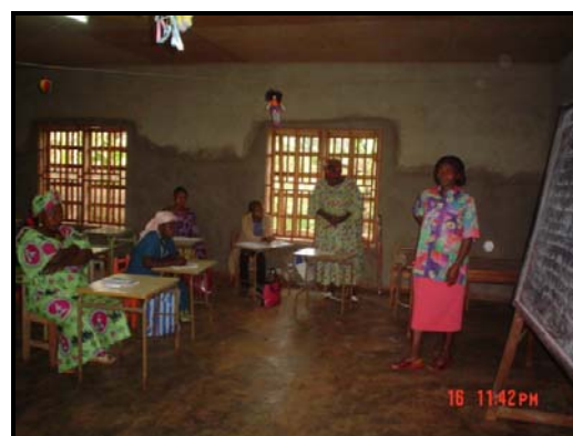
Atelier de renforcement des capacités des femmes en techniques de conservation des produits agricoles

Lors de ces réunions mensuelles qui durent plusieurs heures (celle du 05 août 2005 a duré 3 heures), les dirigeantes des tontines échangent sur leurs difficultés quotidiennes et partagent leurs expériences. Elles apprennent ainsi les unes des autres.