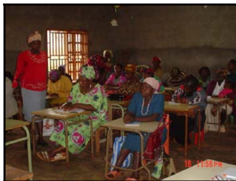
Atelier de formation en stockage et conservation des céréales – maïs et haricot.

Les réactions des femmes ont été très encourageantes au sortir de cet atelier. « Avant d'épandre les engrais dans mon champ, je sais que dois désormais mettre d'abord du fumier comme, par exemple, les fientes de poules », dit une villageoise, à cause de la leçon retenue pendant la formation.