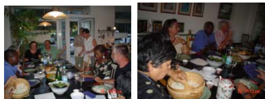
On s'apprête à les déguster mais, avant, une petite pause s'impose pour ...