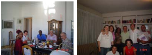
Petit déjeuner chez Hans et... photo de famille des Amis de AFFAMIR de Valladolid lors de la présentation officielle de l'association

Bien avant l'existence de ASAMA, les Amis de AFFAMIR de Valladolid soutenaient déjà P'ONG en finançant son programme éducatif. Avec la création de cette structure, il s'agit surtout de mieux canaliser tous les efforts et bonnes volontés de la Péninsule. Nous souhaitons une longue vie à ASAMA ! ■