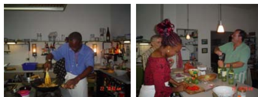
Préparation des plats...