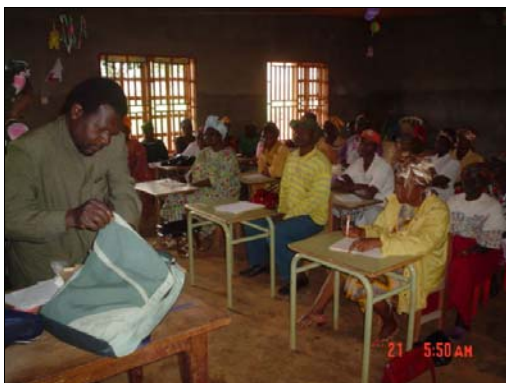
Atelier de renforcement des capacités des femmes par le Vulgarisateur agricole

Les activités ont été intensifiées et les acquis consolidés. L'encadrement des groupes de tontines est un des exemples. Non seulement le nombre de groupes s'est accru de 22 à 25 (le nombre de femmes qui en sont membres étant passé de 1 800 à plus de 2 200), mais cette action a atteint de nouveaux quartiers comme Bansa chefferie. Le nombre de rencontres de discussions autour des points comme l'utilisation de micro-crédits, la stimulation de l'épargne individuelle et de groupe (dans les tontines), le renforcement de la solidarité sont passés à un rythme quasi mensuel malgré les travaux champêtres. Sur ce point, la collaboration avec la Caisse Populaire de Banéghang s'est intensifiée avec une nouvelle assistance financière de Rabobank Foundation qui a permis l'augmentation du fonds pour les micro-crédits productifs.