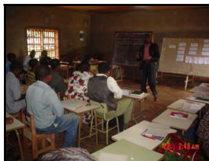
Une attitude des participants pendant l'atelier de recyclage d'août 2005

« Un enseignant qui n'apprend plus ne doit plus enseigner », disait un des participants au dernier atelier de recyclage des enseignants du primaire de l'année dernière. Avec raison. Mais, apprendre quoi, et comment pour faire ce métier qui est tout sauf facile? Le constat que nous faisons aujourd'hui c'est que la plupart des enseignants qui encadrent nos enfants n'ont jamais traversé le seuil d'une école de formation, surtout ceux qui officient en zones rurales, et n'ont par conséquent ni les connaissances qu'ils sont supposés transmettre aux apprenants, ni méthodologie. Parfois, ils sont dotés d'aptitudes qui sommeillent en eux sans qu'ils n'en soient conscients.