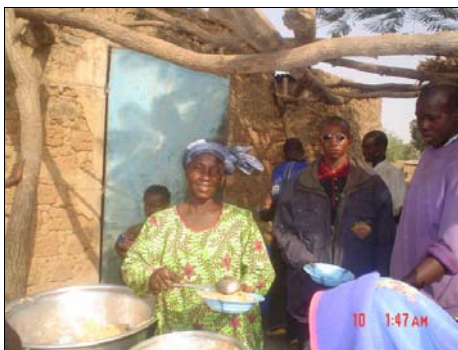
Femme vendant de la nourriture