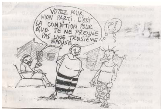
La femme n'est pas souvent libre d'exprimer sa citoyenneté comme bon lui semble...

Est-il normal qu'un homme oblige son épouse ou ses épouses à voter pour son parti et les menace de prendre une autre femme si elles n'obtempèrent pas ?