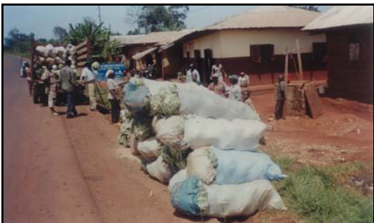
Sacs de choux d'une cliente de la Maison de la Cultivatrice prêts pour la vente.

temps, de la patience et des investissements dans le capital humain. AFFAMIR s'est engagée. Rabobank Foudation a accepté de suivre. Le projet démarre dès juillet 2006 pour deux phases. Une phase d'exploration (des solutions, du modèle adapté aux structures culturelles et mentales de la région tout en étant orienté vers le marché) de 2006 à 2010 et une phase de développement à partir de 2012.