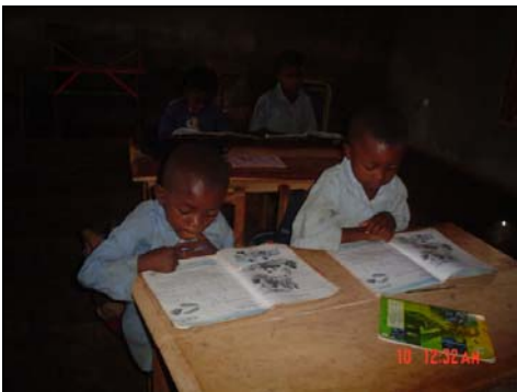
Scéance de lecture au CP de la Kinder's House de Banock.

« Depuis que mes enfants vont à la Kinder's House, ils sont plus éveillés, sont curieux de tout, posent beaucoup de questions sur leur environnement, s'expriment mieux qu'avant et couramment, et n'ont plus peur des étrangers. Ils s'expriment en français, en anglais, sont propres, polis, très polis. C'est extraordinaire pour leur âge. Même celui qui était le délinquant de la famille a changé ! Maintenant, lorsqu'il se lève le matin, il me dit bonjour, et lorsqu'il rentre de l'école, il me salue également, ce qui était impossible avant qu'il ne commence à fréquenter la Kinder's House. Les enseignants doivent continuer dans la même lancée. Nous les encourageons car ils font du bon travail ».