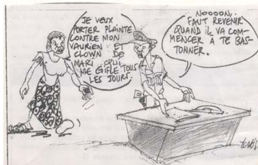
Très souvent, frapper sa femme n'est pas considéré comme de la violence, mais comme quelque chose de « normal »...

Si, toutes petites, elles réclament un aspirateur, un dé, ou un balai, il n'y a pas de problème car elles ne font que reproduire un schéma dessiné depuis les temps immémoriaux. Nous les femmes les aidons même, sciemment ou inconsciemment, à s'installer dans ce moule. Par l'éducation que nous leur donnons, par l'orientation de leur vie que nous faisons en fonction de leur sexe et non de leurs goûts et compétences, par le choix des jouets très souvent déterminé par le sexe de l'enfant à qui il est destiné, et qui conditionne les tout petits à endosser plus tard des rôles stéréotypés : maternité, travail domestique et coquetterie pour les petites filles ; bricolage, voitures, aventure et guerre pour les garçons.