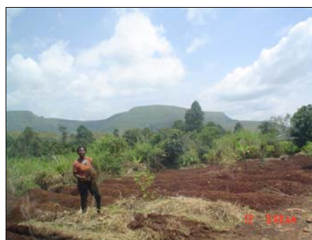
La femme cultive, mais elle ne peut pas hériter...

Les coutumes sont là depuis la nuit des temps et nous ne pouvons pas les changer.