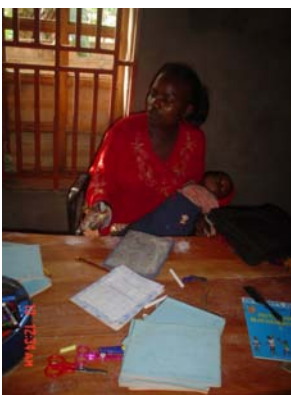
L'une des maîtresses en plein cours avec son bébé dans les bras

Tant que les besoins spécifiques des femmes ne seront pas pris en compte dans les projets dans la lutte contre la pauvreté, ce mal du siècle ne sera pas véritablement éradiqué. Parce que AFFAMIR est consciente, elle a choisi, dès sa création, la promotion de la femme comme premier axe stratégique. Elle œuvre pour améliorer non seulement les conditions de vie des femmes, mais aussi leur situation, leur position sociale.