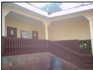
Le nouveau visage de la Kinder's House de Banock

☞ L'Assemblée Générale de AFFAMIR aura lieu en août prochain, l'occasion de mesurer le chemin parcouru pendant l'année et de se projeter aussi dans le futur. Ce sera aussi l'occasion de saluer le combat mené par les femmes contre la pauvreté et de récompenser les efforts qu'elles fournissent individuellement ou à travers leurs groupes pour leur autonomisation. En effet, l'ONG a institué deux