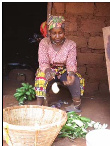
La femme est la principale responsable de la nutrition de la famille

Qu'ils ont tort de le faire parce que AFFAMIR c'est ce qui nous manquait dans ce village.