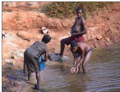
Elles s'y lavent et vont boire la même eau...

-plus d'un milliard de personnes n'ont pas accès à une eau salubre ni à l'assainissement, et 2,6 milliards ne bénéficient pas d'un meilleur accès sanitaire.