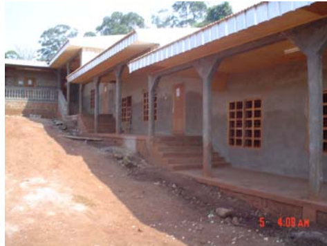
Les nouveaux locaux de la Kinder's House Banock