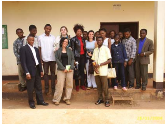
Campagne de sensibilisation contre les IST au Collège Polyvalent de Banéghang (photo 1) et photo de famille des étudiants d’espagnol de l’Université de Dschang, des volontaires et la coordinatrice de l’AFFAMIR après une table-ronde sur le même thème (photo 2).