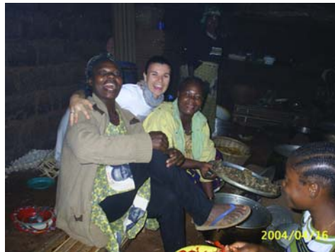
Echange culturel entre les volontaires de l’AFFAMIR et la population locale