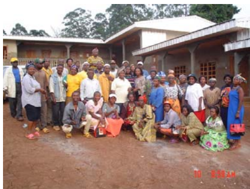
Photo de famille Assemblée Générale AFFAMIR 2004

L'Assemblée Générale de l'AFFAMIR s'est tenue en décembre 2004, et portait surtout sur l'analyse critique de l'action de la structure au courant de l'année ainsi que des résultats atteints. Au terme de celle-ci, des résolutions ont été prises pour continuer à consolider les acquis, développer davantage de stratégies plus efficaces pour atteindre les objectifs fixés, et ne pas trop s'éloigner des axes stratégiques tracés en 2003.