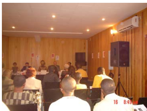
Conférence à l'institut Goethe de Yaoundé